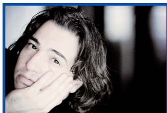
La star turca del pianoforte Fazil Say , 39 anni, è tra gli ospiti della Società dei Concerti