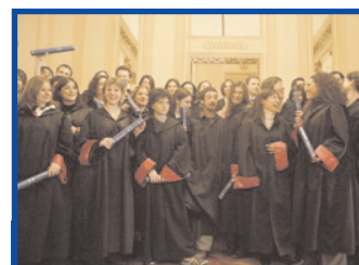
Gli studenti di un master promosso dall'Accademia d'arte e mestieri del Teatro alla Scala

Anche quest'anno l'Accademia del Teatro alla Scala attiva numerosi master di perfezionamento in tutti i settori professionali del teatro d'opera, ma non solo. L'organizzazione dei corsi è divisa in quattro macro-aree di formazione: musica, danza, palcoscenico-laboratorio e management . Nel dipartimento musica sono attivi il corso di perfezionamento per ensemble da camera su repertorio del Ventesimo secolo (ottobre 2009 - giugno 2010) e l'Accademia di perfezionamento per cantanti lirici (ottobre 2009 - luglio 2011). La sezione palcoscenico-laboratorio ospita il corso di tecnologia audio (novembre 2009 - luglio 2010), mentre nell'area dedicata al management sono attivi il corso